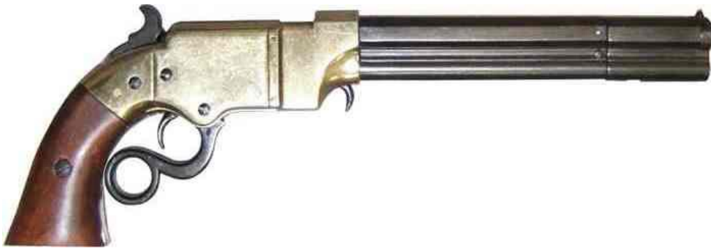
Vít Kašpárek 7.B

Kvůli nábojům Volcanic nebyl univerzální, a proto se moc nepoužíval. Nebezpečným ho ovšem činil velký zásobník (pod hlavní), vysoká rychlost střelby a rychlost přebíjení (nebylo nutné odhazovat nábojnice, protože prach byl uložen pouze v náboji).