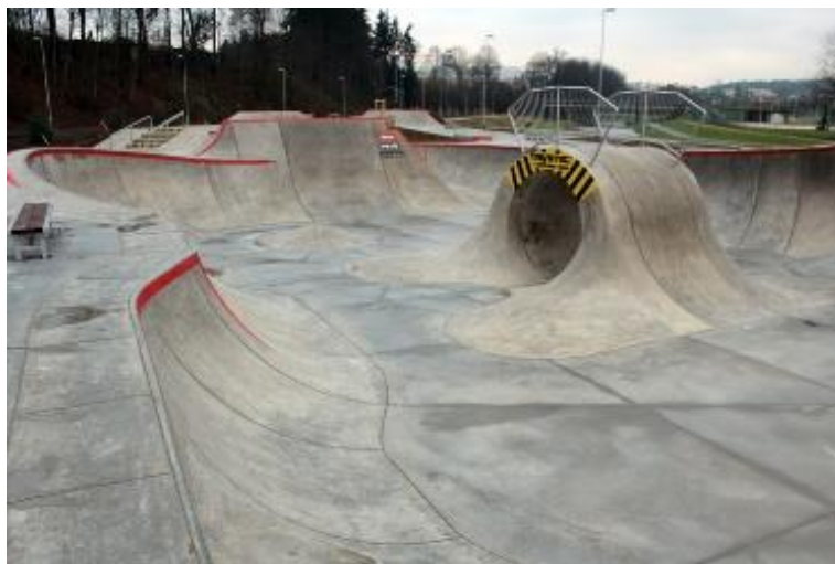
Skatepark Jihlava: (jeden z nejlepších v ČR)

Ze skateboardu se později stal jak dopravní prostředek, tak zdroj zábavy, protože na nich lidé začali dělat nepředstavitelné triky a skoky. Pro tyto hrátky jsou určeny různé skateparky.