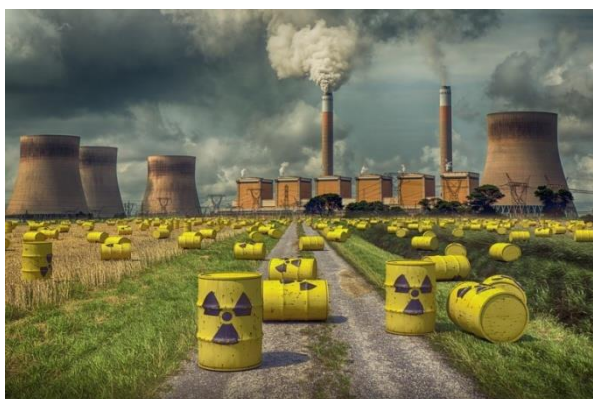
ruská jaderná elektrárna

Životní prostředí je systém složený z přírodních, umělých a sociálních složek materiálního světa, jež jsou nebo mohou být s uvažovaným objektem ve stálé interakci. Je to vše, co vytváří přirozené podmínky existence organismů, včetně člověka a je předpokladem jejich dalšího vývoje. Složkami je především ovzduší, voda, horniny, půda, organismy, ekosystémy a energie. Uvedená definice je pak bez své první věty i definicí legální.