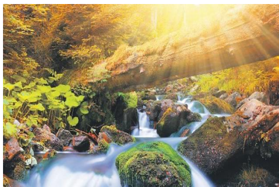
Toto nám dala příroda.

Ve vzduchu je 21 % kyslíku, 78 % dusíku a 1 % jiných plynných látek.