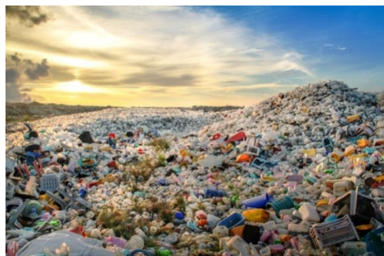
Toto jsme dali my jí.